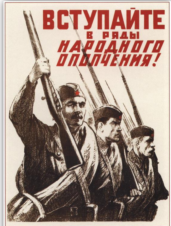
284. Ситтаро А. Вступайте в ряды народного ополчения! 1941